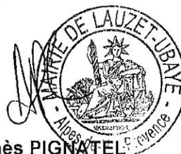
Agnès PIGNATEL Maire

Ainsi fait délibéré en séance, les jour, mois et an que ci-dessus. Pour extrait certifié conforme