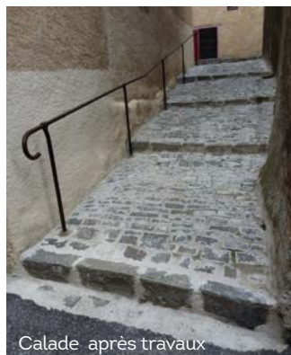
Calade après travaux