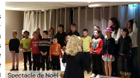
Spectacle de Noël

Au printemps dernier, les élèves de CM2 ont participé au voyage annuel de l'Ubaye à Paris. Les autres enfants sont allés en classe de découverte au centre Chantemerle à Seyne-les-alpes. Une vingtaine d'élèves s'est rendue au parc Vulcania.