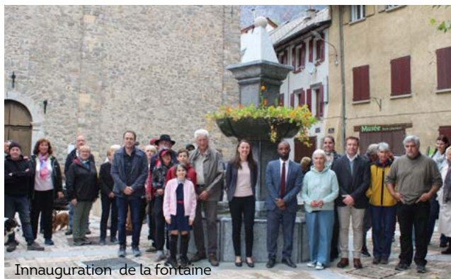
Inauguration de la fontaine