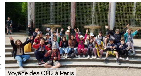
Voyage des CM2 à Paris

Le regroupement pédagogique du Lauzet-Méolans est toujours aussi dynamique. Effectif 33 élèves.