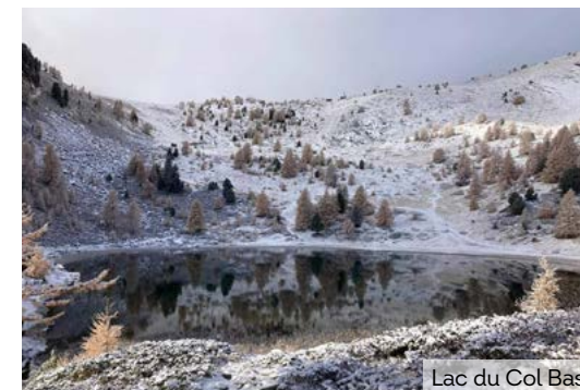
Lac du Col Bas

Il fait également l'objet d'une révision de l'APPB (Arrêté Préfectoral de Protection de Biotope) qui sera finalisée en milieu d'année 2023. Enfin, une zone Natura 2000 est aussi présente. Autant dire que, sans être sanctuarisés, le plateau de Dormillouse et ses zones humides font l'objet d'une attention et d'une protection accrues de la part de la commune, du département et de l'État.