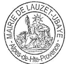
Agnès PIGNATEL MAIRE