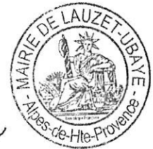
Agnès PIGNATEL MAIRE