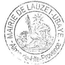
Agnès PIGNATEL MAIRE